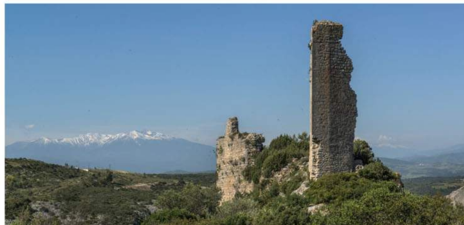
Le château de Tautavel.