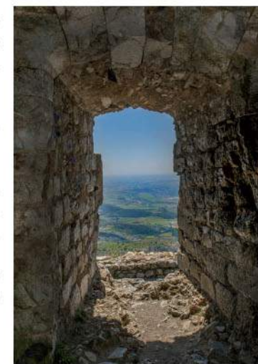
La tour del Far domine la plaine.

7 Le retour sur Tautavel se fait par le même itinéraire.