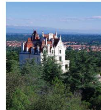
Le château de Valmy