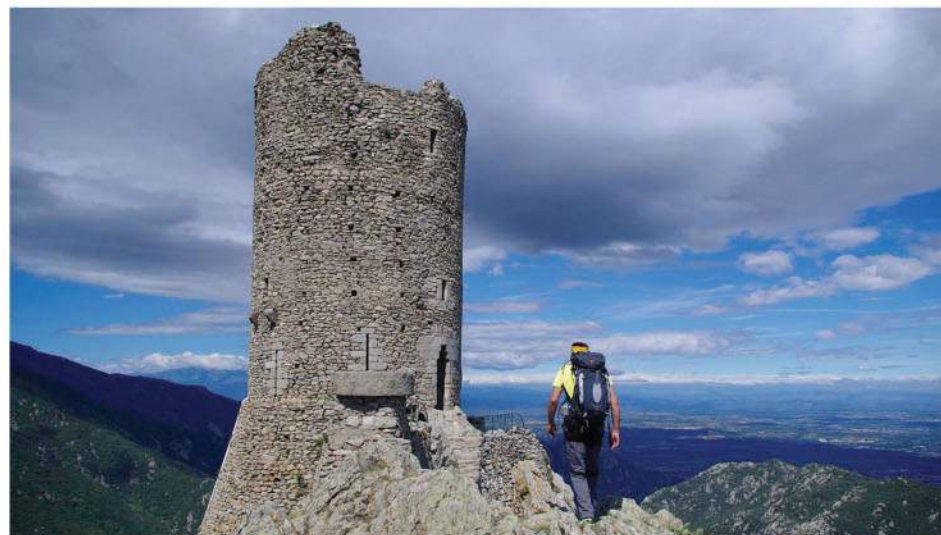
La tour de la Massane

Communauté de Communes Albères Côte Vermeille